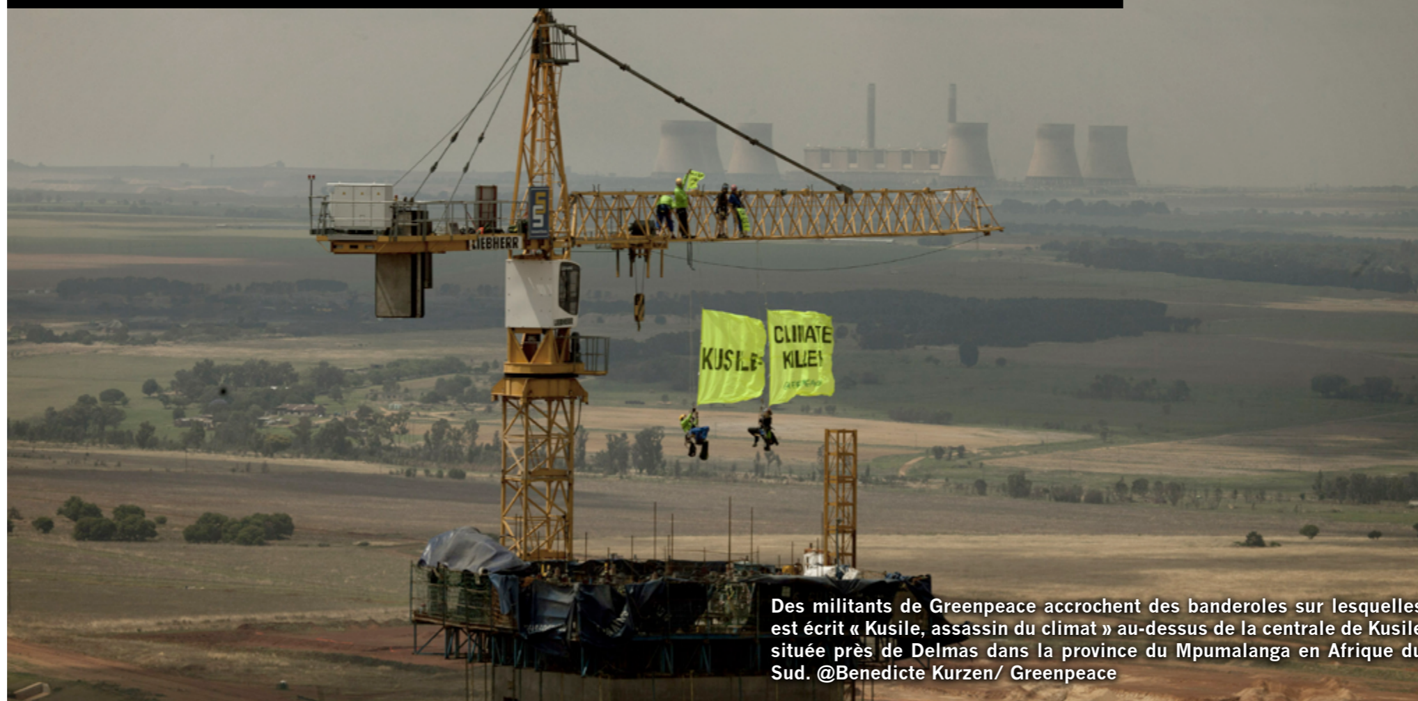
Des militants de Greenpeace accrochent des banderoles sur lesquelles est écrit « Kusile, assassin du climat » au-dessus de la centrale de Kusile située près de Delmas dans la province du Mpumalanga en Afrique du Sud.

de la banque au charbon, comme le prouve ses soutiens toujours très élevés à ce secteur.