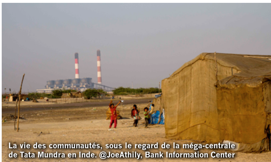
La vie des communautés, sous le regard de la méga-centrale de Tata Mundra en Inde.