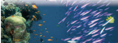
Great Barrier Reef

» Loin de ses discours en faveur d'une « économie moins carbonée », la Société Générale joue un rôle central dans ce projet qui nous rapprocherait d'un réchauffement de 2°C, point de non-retour au-delà duquel les changements climatiques s'emballeraient.