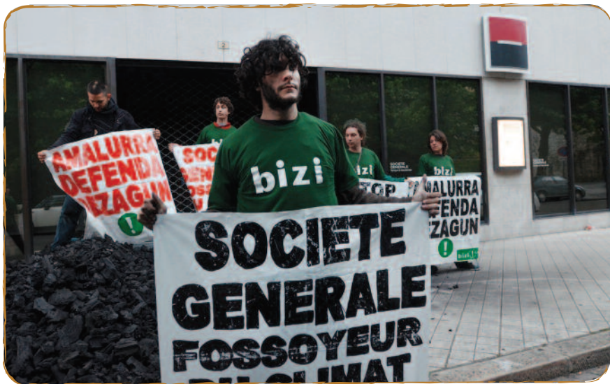
Action de Bizi devant une agence de la Société Générale à Bayonne pour dénoncer le projet Alpha Coal.

Malgré les appels répétés de la communauté scientifique internationale à laisser plus des 2/3 de nos réserves en énergies fossiles dans le sol afin de limiter la hausse de la température du globe en dessous de la barre des 2 °C, l'extraction de pétrole, charbon, gaz, sables bitumineux, etc. ne cesse d'augmenter.