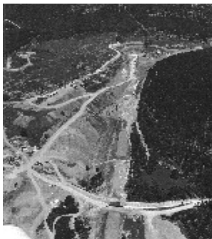
Chantier TGV Madrid - Seville (à imaginer du côté d'Ahetze).

nous oblige à sanctionner le projet de voies nouvelles TGV.