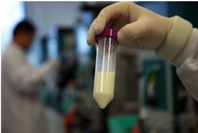
Flacon d'algues au laboratoire de Solazyme. Pour Ecover, l'huile produite à partir de cette algue est un produit « naturel » qui remplace l'huile de palme.