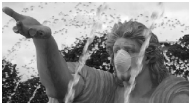
Action réalisée sur la fontaine de la Croix de Berny pour alerter sur la pollution de l'air à Antony