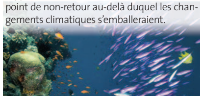
Great Barrier Reef

» Loin de ses discours en faveur d'une « économie moins carbonée », la Société Générale joue un rôle central dans ce projet qui nous rapprocherait d'un réchauffement de 2°C, point de non-retour au-delà duquel les changements climatiques s'emballeraient.