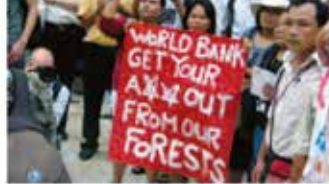
Demonstration där Friends of the Earth Indonesien kämpar för att försvara sina rättigheter till skogen, 2007.

Marknaden: Då arter och ekosystem blir utrotade vilket även ökar risken att man får mer uppmuntran till att maxime-