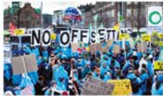
Aktivister som demonstrerar mot koldioxidkompensation i Köpenhamn 2009.