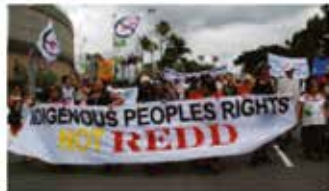
En demonstration för att försvara ursprungsfolks rättigheter mot REDD mekanismer i Cancún 2010.