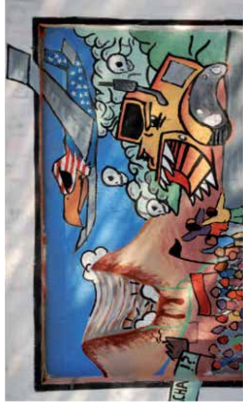
Väggmålning av samhällen som påverkas av gruvdrift i Argentina.

För mer information: Report by Mark Shapiro, Brasilien: The Money Tree, 2009