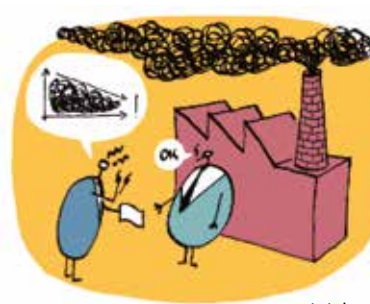
Bildandet av koldioxidmarknaden i Europa... En begränsad mängd utsläpps rättigheter (motsvarande ett ton koldioxid) ges till industrierna. Den

totala mängden av dessa utsläpp måste minska för att besvara det akuta klimathotet.