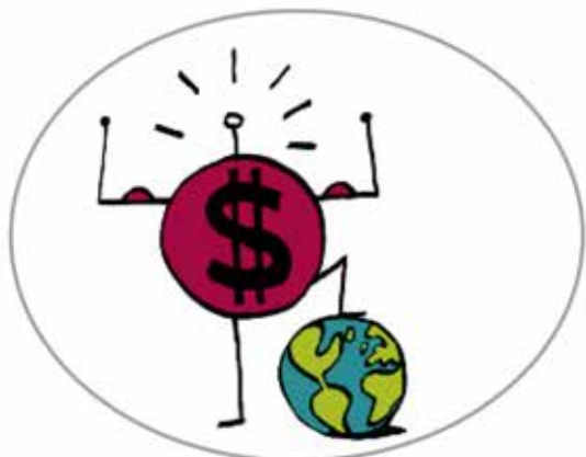
den finansiella sektorns utökade inflytande inom världsekonomin