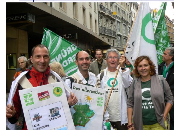
Manifestation contre le Grand Marché Transatlantique à Genève – Samedi 11 Octobre