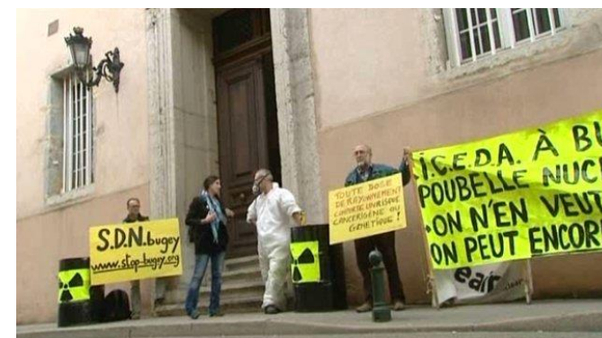
Manifestation devant le palais de justice