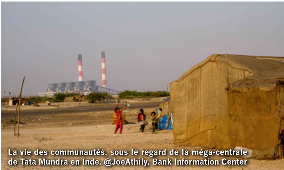
La vie des communautés, sous le regard de la méga-centrale de Tata Mundra en Inde.