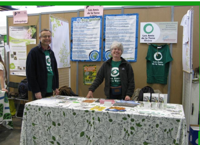
Salon Primevère Eurexpo Février 2012