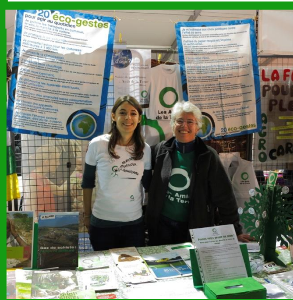
Village de la solidarité internationale